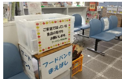
前橋中央郵便局の常設食品回収箱