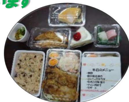
提供した食品を含めて作られたメニュー